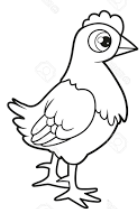
Jeunes poules Nos poussins